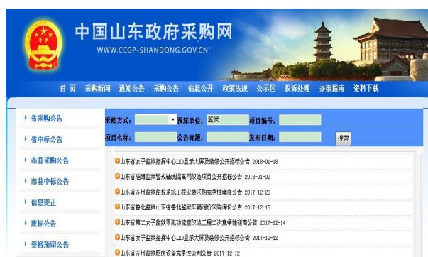
省监狱局门户网站公开省局人事信息情况