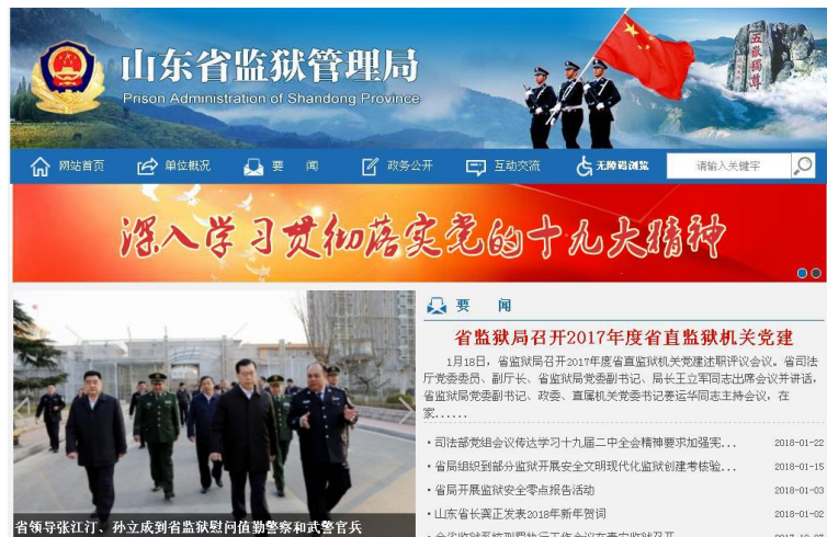
山东省监狱管理局门户网站

(三) 优化融合政务(狱务)公开渠道, 增强公开工作实效。进一步加强与媒体联动, 开展联合采编工作, 加强对重大活动、重要工作动态的报道, 宣传监狱工作成果和实效, 促进公众对监狱工作的理解和支持。11月23日, 中央电视台新闻频道法治在线栏目播出《监狱里的特殊庭审》, 专题报道了我省滕州监狱与枣庄市中级人民法院通过远程视频法庭开庭审理减刑、假释案件的有关情况, 充分肯定了我省监狱减刑假释案件办理的透明性和公正性。发挥山东监狱网信息公开第一平台作用, 及时发布、更