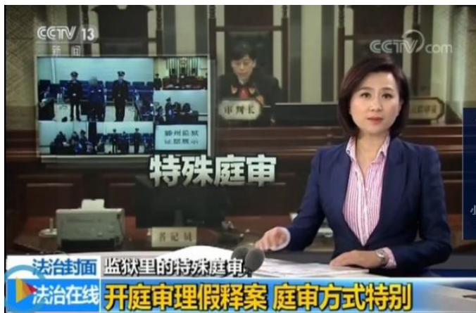
中央电视台报道滕州监狱远程视频