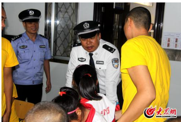
监狱组织社会帮教活动